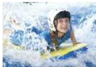
Bay Leisure Ltd. Abertawe