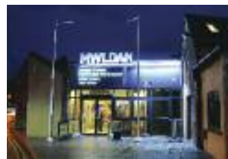
Theatr Mwlana Aberteifi