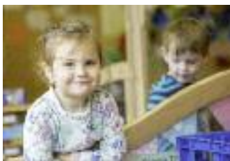
Partneriaeth Fern Maerdy

Mae'r dystiolaeth yn dangos sut gall busnesau cymdeithasol llwyddiannus gynhyrchu buddiannau sylweddol yn eu cymunedau. Mae hyn yn mynd ymhell y tu hwnt i'r elw ar fuddsoddiad ac yn cwmpasu effeithiau buddiol ehangach ar hyd y tri phrif ddimensiwn, sef datblygu economaidd, swyddi a chyflogaeth a chydlyniant cymdeithasol.