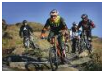
Antur 'Stiniog Blaenau Ffestiniog