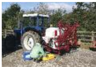
P.M.R. Ltd (Pembrokeshire Machinery Ring) Hwlfordd