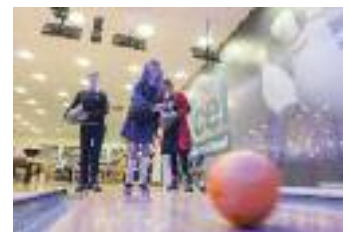
Eglwys Gymunedol Tywi Caerfyrddin