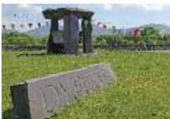
Antur Nantlle Cyf Caernarfon