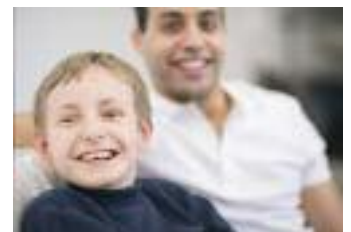
Croesffyrdd Sir Gâr Llanelli